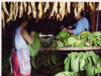
Cigarfabrik i Estelí.

Hotel Alameda, Carretera Panamericana, Shell Esquipulas 1 Cuadra al Este, 1 Cuadra al Sur (505)2713-6292, (505)2713-2373, (505)2713-5219 (FAX)