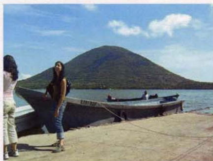
Båden fra Coyolito og til Isla del Tigre.

Vi fortsætter sydpå og kører igen ind i Honduras. Før vi kommer til Choluteca, drejer vi af og kører ud til fiskerbyen Coyolito ved Fonseca bugten i Stillehavet.