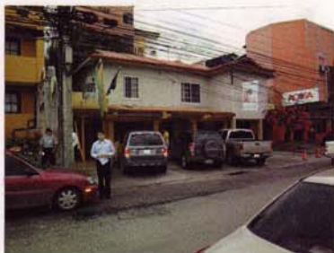
Casa del arbol.

Vi kører fra Tegucigalpa og frem til Comayagua, hvor vi gør holdt. Byen spores helt tilbage til spaniolernes ankomst til Mellemamerika. Da var byen på det ene led midtpunktet mellem Caribien og Stillehavet, samt mellem Guatemala og Nicaragua på det anden led. Herfra fortsætter vi nordvest over mod San Pedro Sula. På en lang strækning kører vi langs Yojoa søen, der er 22 ½ km lang og ligger 635 meter over havet med flotte bjerge omkring. Vi gør holdt undervej for at nyde den meget smukke natur langs Yojoa søen, inden vi når frem til San Pedro Sula, hvor vi skal overnatte. (ca. 250 km.)