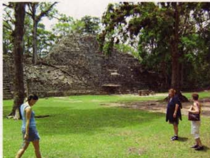
Las ruinas de Copan,