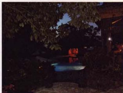
Swimmingpoolen på hotel Los Almendros de San Lorenzo i skumringen.

Så kører vi videre og op over bjergene i de mere ukendte dele af Honduras. Det var dette område, der slutningen af 60'erne var uenighed om grænsedragningen og det, som efter en fodboldlandskamp mellem El Salvador og Honduras førte til den såkaldte fodboldkrig. Vi kører frem til grænseovergangen el Poy for at komme ind i El Salvador. Når vi har kørt over broen over Embalca Cerron Grande, der er en kunstig opdæmmed sø, drejer vi første gang af til mod øst. Her kører vi på gamle brolagte veje, hvor der nogen steder nu kun er jord. Lige inden vi kommer til Suchitoto, kommer vi igen ud på landevejen og få minutter senere er vi fremme. Her skal vi overnatte på hotel Los Almendros de San Lorenzo, hvor der kun er plads til os, fordi vi foruden almindelige værelser har lejet to suiter, hvor der i hver er 2 sovesteder med hver to senge. (ca. 325 km).