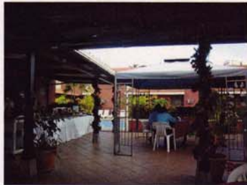
Restauranten på hotel Alameda.

Hotel Alameda, Boulevard a Suyapa, frente a Gasolinera ESSO, Tegucigalpa, M.D.C., Honduras, tel: (504) 2232 6920, 232 6902, 232 6879, fax: (504) 232 6932,