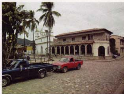
Hotel Plaza Copan og et hjørne af den centrale plads.

Vi starter med at følge hovedvejen mod Guatemala City, men drejer af mod Zacapa og videre til grænseovergangen el Florido, hvor vi igen krydser grænsen til Honduras for at komme frem til byen Las runias de Copan, der er en smuk bjergby i koloniansk stil. Her overnatter vi på hotel Plaza Copan lige ud til byens centrale plads. Den første nat har vi det problem, at der ikke er dobbeltværelser nok. Så vi må i et par enkeltværelser have en ekstra seng sat op, men kun for denne nat. (ca. 350 km.)