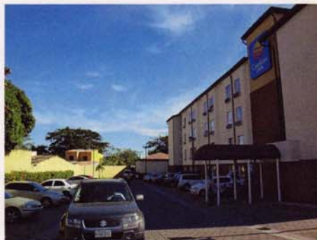
Hotel Comfort Inn Real, San Miguel.

Comfort Inn Real San Miguel, Final Av. Roosevelt, Salida a La Union, Esquina opuesto a Metrocentro, San Miguel, tel: (503) 2600 0202, fax: (503) 2600 0203,